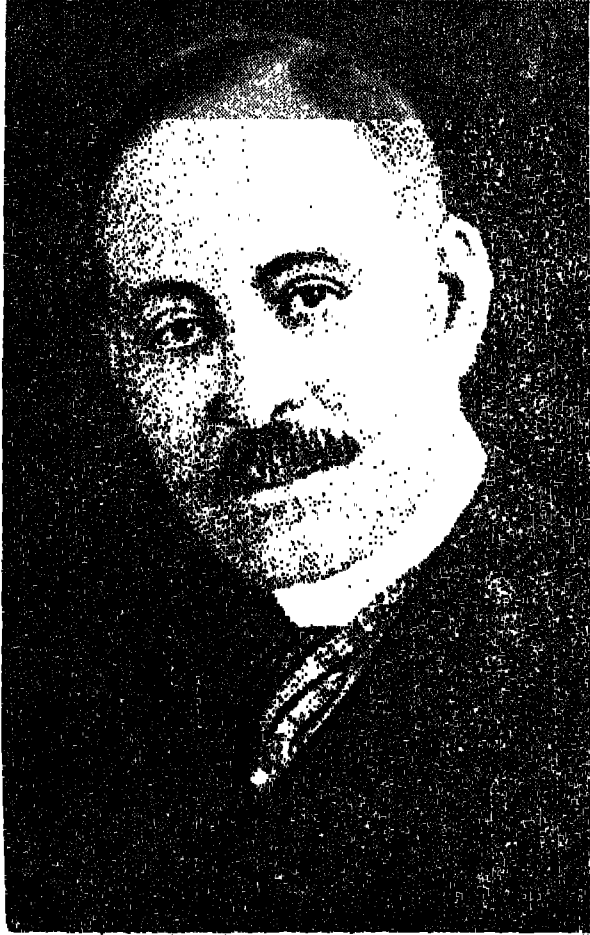
डेनिअल हेल विलियम्स